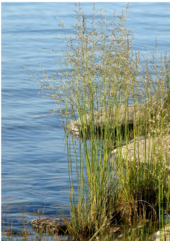
Gultåtel är inte rädd för lite salt. Den kan växa ända ut i vattnet vid världsarvets stränder!

Nedan kan ni se bilder på två växter som klarar sig bra på stranden.