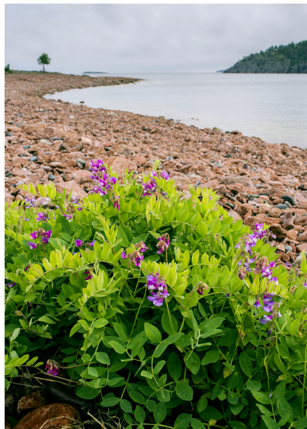
Strandvial klarar sig lätt på våra stränder. Om det inte finns näring i sanden kan den hämta det ur luften istället.