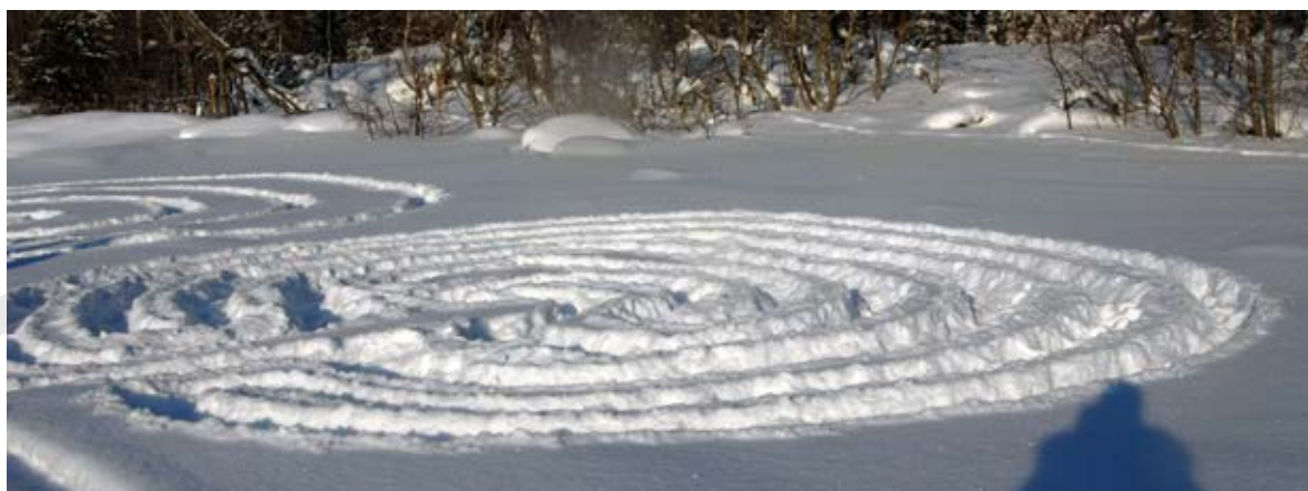
Kuva: Anita Storm