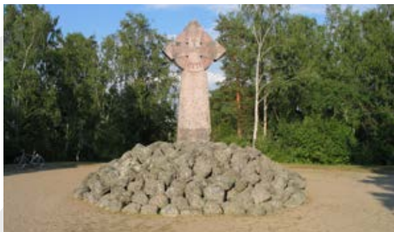
Muistomerkki Korsholman linnan vallien luona.

Linnoitus menetti vähitellen sotilaallisen ja strategisen merkityksensä ja toimi pääasiassa maaherran hallintopaikkana 1700-luvun puoleenväliin asti. Se