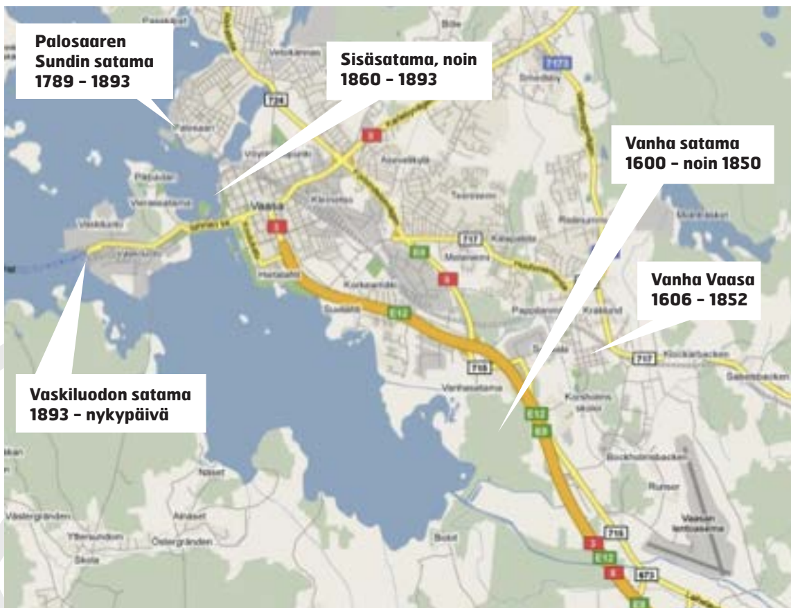
Vaasan kaupungin eri satamat.

Rakentakaa vapaasti valittavista materiaaleista kolmiulotteinen malli yllä olevasta Vaasan karttakuvasta. Mallin voi rakentaa joko luokkahuoneessa tai ulkona maahan. Merkitkää malliin eri satamapaikat! Kertokaa sen jälkeen Vaasan perustamisesta, eri satamapaikoista sekä satamien siirtämisen syistä.