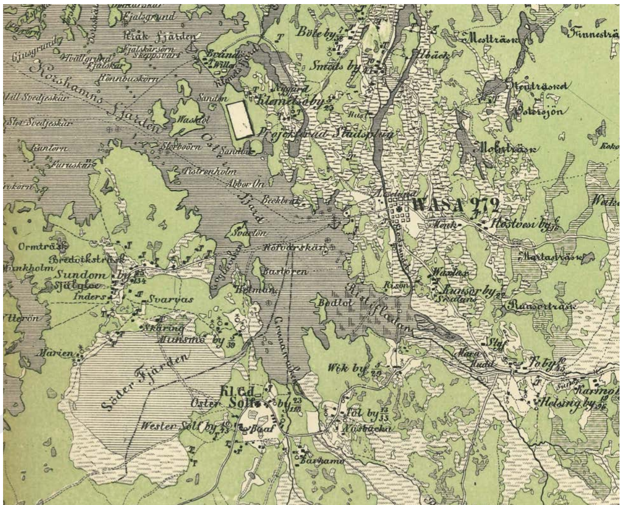
Vaasan (1856) ja Kälviälän (1856) kartat. (Alkuperäiskartta 1:100 000, vihreä ja ruskea painatus.)