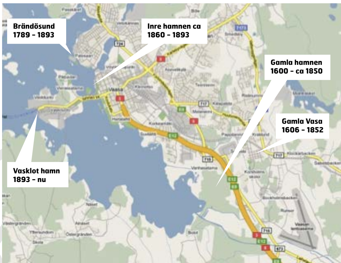
Vasa stads olika hamnar

Bygg en tredimensionell modell på marken eller i klassrummet i valfritt material av kartbilden över Vasa och sätt ut de olika hamnlägena! Presentera sedan lite fakta om Vasas grundande, de olika hamnlägena samt orsakerna till förflyttningen av hamnen.